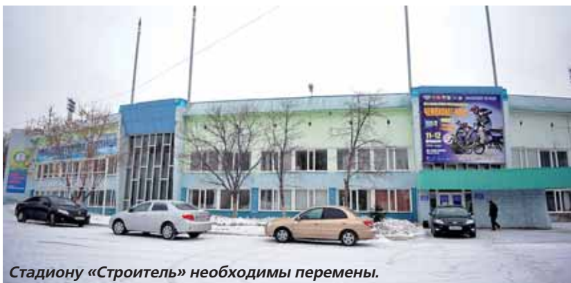
Стадиону «Строитель» необходимы перемены.

Правда, есть одно «но». Любителей природы смущает, что из-за строительства производится вырубка деревьев. Но на деле прореживание лесополосы под будущие лыжные трассы будет иметь скорее положительные последствия, обещают специалисты.